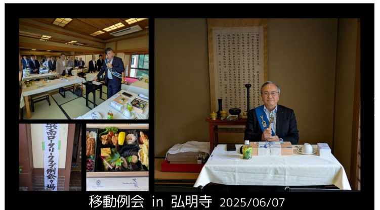
移動例会 in 弘明寺 2025/06/07