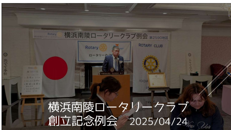
横浜南陵ロータリークラブ 創立記念例会 2025/04/24