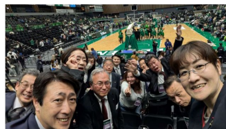
横浜エクセレンス観戦会 2025/04/12