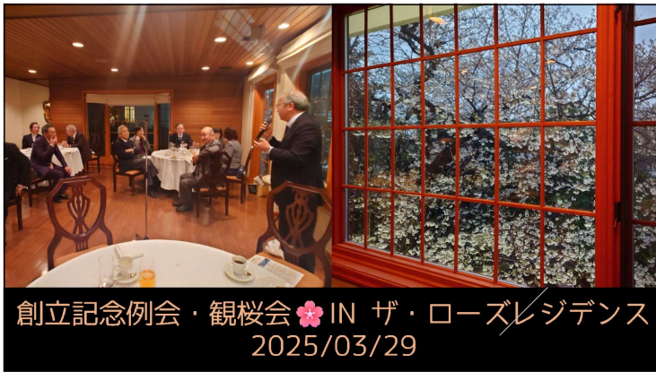
創立記念例会・観桜会🌸 IN ザ・ローズレジデンス 2025/03/29